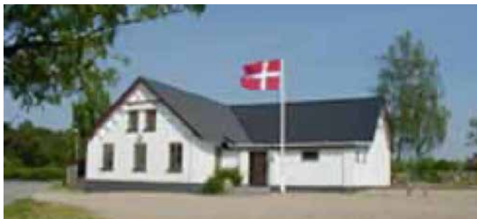
Logen Saxum. Billede fra 2023

Bygningen er opført i sidste halvdel 1895 og citat: Formålet med bygningen "Bramdrupdams Øvelseshus" er at den vedligeholdes og at gymnastik og skytteforening samt foredrag sikres plads til deres forskellige aktiviteter. Formentlig er øvelseshuset opført af sognet og med en bestyrelse på: 1 sognefoged, 1 restauratør og 4 gårdejere.