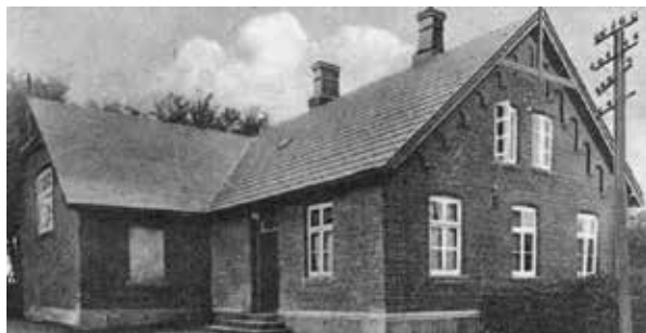
Bramdrupdam Øvelseshus. Billede fra ca 1930